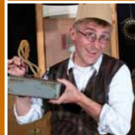
Kindertheater im Stadtteil