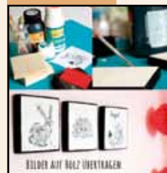
BILDER AUF HOLZ ÜBERTRAGEN